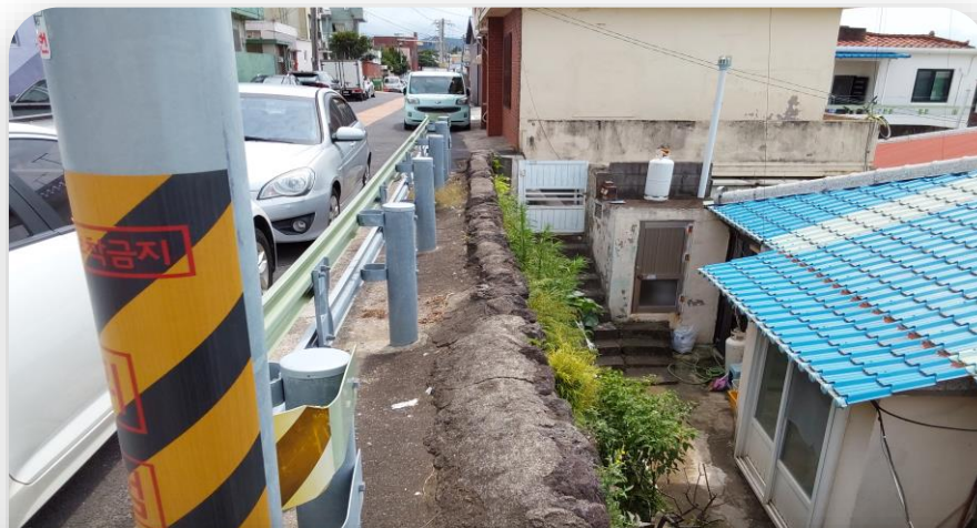
건물 외부 전경 (2)