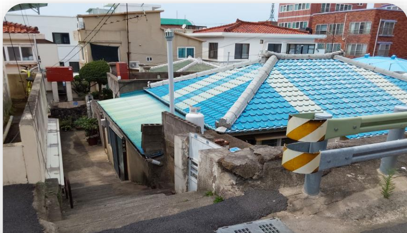
건물 외부 전경 (1)