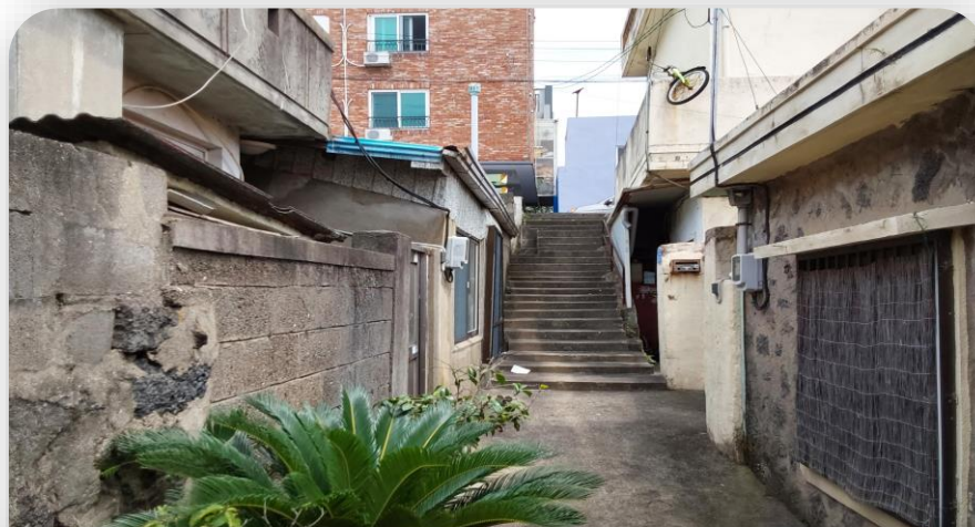
내부 접도 부분