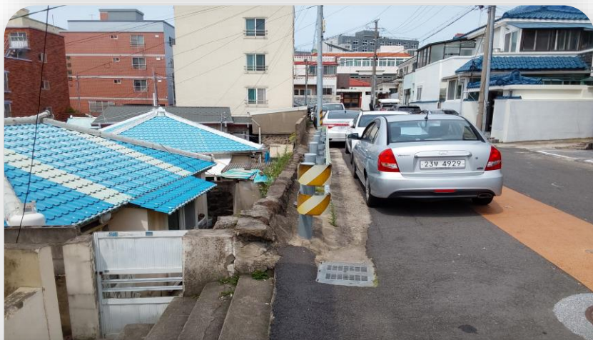
외부 접도 부분