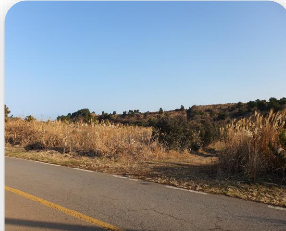
봉성리 산 109-4 인접 도로