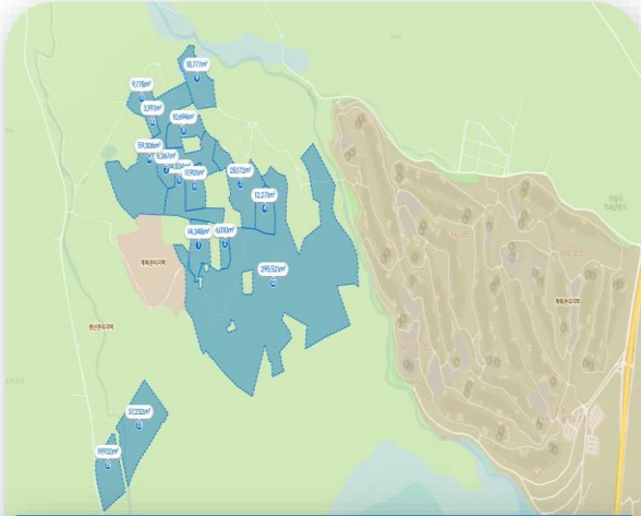
전체 필지 지적도