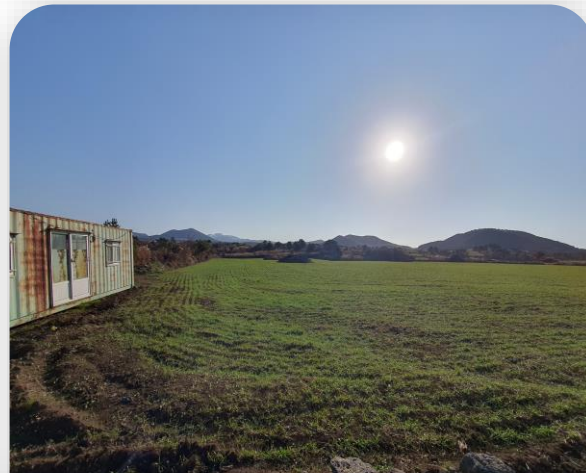
주위 전경 (2)