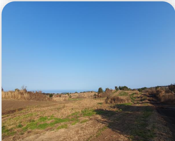
주위 전경 (1)