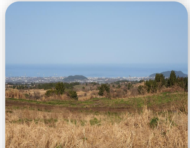
주위 전경 (3)